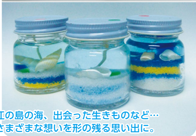
江の島の海、出会った生きものなど… さまざまな想いを形の残る思い出に。

実施時間：平日 9:00 ~ 12:00 ※時間は変更になる場合があります 所要時間：約 30 分 ※館内見学、ショー見学時間は含まれていません 対象：小学生以上 人数：20~54名 費用：材料費 220 円 ※水族館入場料は別途