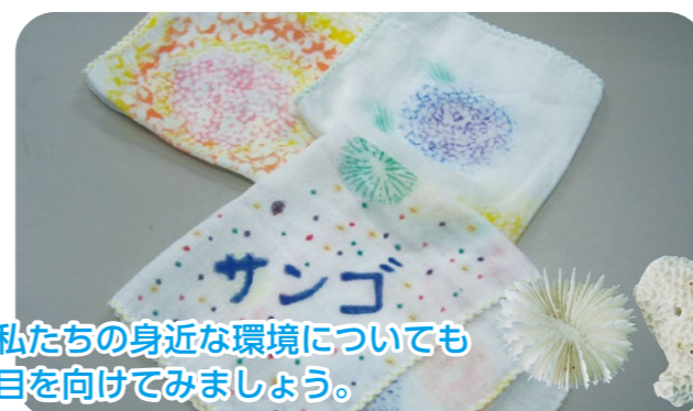
私たちの身近な環境についても 目を向けてみましょう。

実施時間：平日 9:00 ~ 12:00 ※時間は変更になる場合があります 所要時間：約 40 分 ※館内見学、ショー見学時間は含まれていません 対象：小学生以上 人数：20~54名 費用：材料費 110 円 ※水族館入場料は別途