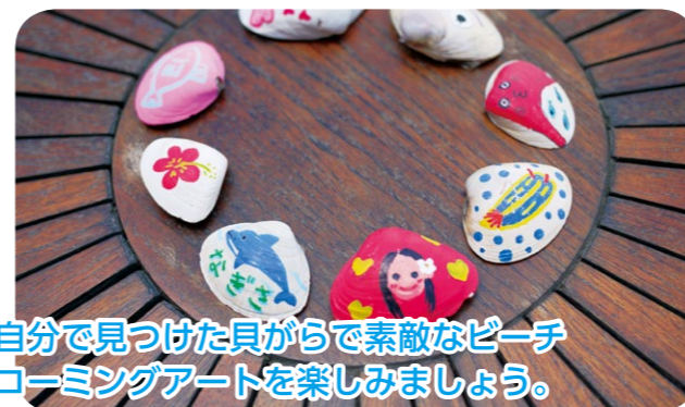
自分でつけた貝がらで素敵なビーチコーミングアートを楽しみましょう。

実施時間：平日 9:00 ~ 12:00 ※時間は変更になる場合があります 所要時間：約 30 分 ※館内見学、ショー見学時間は含まれていません 対象：5歳以上 人数：20~54名 費用：無料 ※水族館入場料は別途 持ち物：ビーチコーミングで集めた二枚貝の貝がら(直径 5cm 程度) ※ビーチコーミングの実施が難しい場合はご相談ください