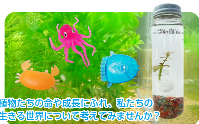
植物たちの命や成長にふれ、私たちの 生きる世界について考えてみませんか？

実施時間：平日 9:00 ~ 12:00 ※時間は変更になる場合があります 所要時間：約 30 分 ※館内見学、ショー見学時間は含まれていません 対象：小学生以上 人数：20~54名 費用：材料費 330 円 ※水族館入場料は別途