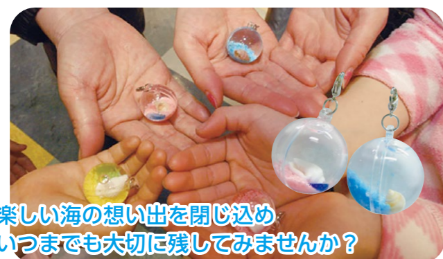
楽しい海の思い出を閉じ込め いつまでも大切に残してみませんか？

実施時間：平日 9:00 ~ 12:00 ※時間は変更になる場合があります 所要時間：約 30 分 ※館内見学、ショー見学時間は含まれていません 対象：小学生以上 人数：20~54名 費用：材料費 220 円 ※水族館入場料は別途