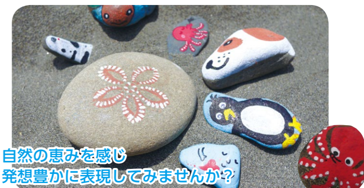
自然の恵みを感じ 発想豊かに表現してみませんか？

実施時間：平日 9:00 ~ 12:00 ※時間は変更になる場合があります 所要時間：約 30 分 ※館内見学、ショー見学時間は含まれていません 対象：5歳以上 人数：20~54名 費用：無料 ※水族館入場料は別途 持ち物：ビーチコーミングで集めた石(直径 5cm 程度) ※ビーチコーミングの実施が難しい場合はご相談ください